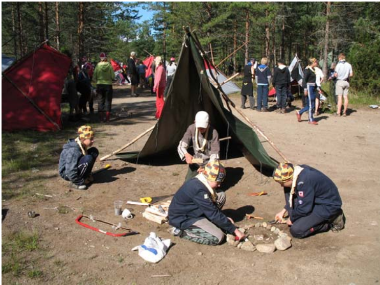
Kuva Piia Stenhäll