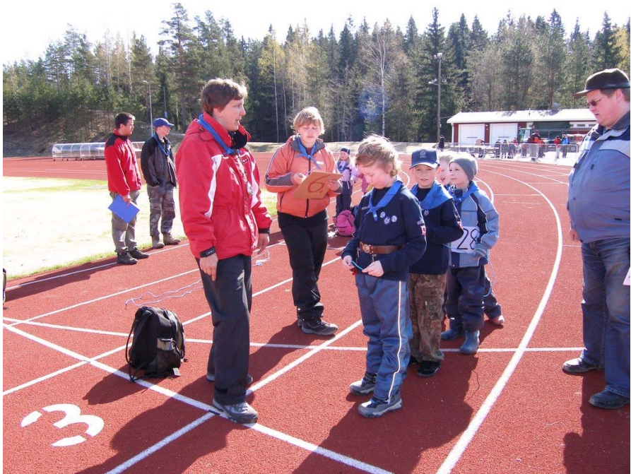
Kuvassa ollaan piirin partiotaitokisa Rakettimatalla Kangasalla 5.5. Haukat-lauma lähtövalmiina esterata-rastilla.