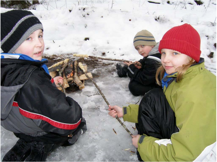
Kuva maaliskuiselta Aarrejahti-yöretkeltä Jokisalosta. Tikkupullaa paistamassa Sisiliskot-lauma.