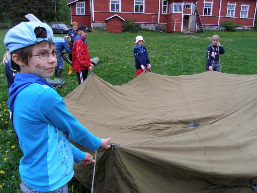
Kuvassa ollaan sudenpentujen telttaretkellä Sirkkalassa toukokuun lopussa, kuvassa Marsutiivit-lauma pystyttää telttaa.